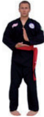
Chuan Bi Tan