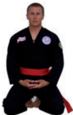
Toa Tien Tan