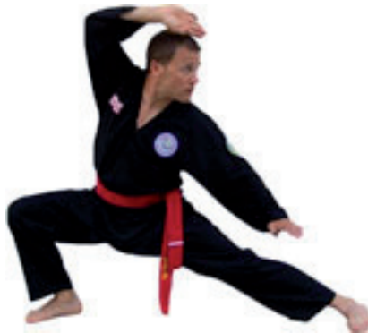
Long Ma Tan