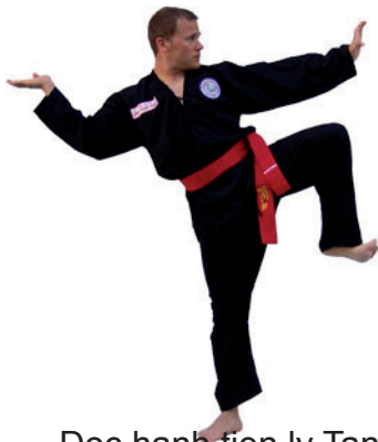
Doc hanh tien ly Tan